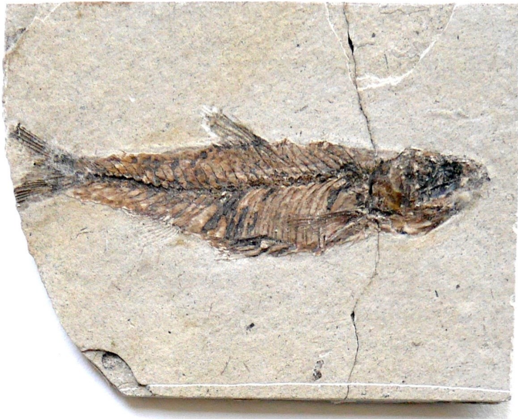
Fürstlich Fürstenbergische Sammlungen Donaueschingen, Vitrine 49, Skelett eines Weißfisches Leuciscus pussillus AGASSIZ (Pz 3477.2).

Zu den bekanntesten Öhninger Funden zählen die Amphibien, von denen in Donaueschingen vier nicht ganz vorzügliche Stücke erhalten sind, die durch zwei Abgüsse aus dem Naturkundemuseum Karlsruhe flankiert werden. Zwei Platten zeigen den „Öhninger Riesenfrosch“, der mit dem heute in Südamerika beheimateten Ochsenfrosch verwandt gewesen sein dürfte. Zwei weitere Platten zeigen Reste des berühmtesten aller Öhninger Fossilien, das zugleich von großem wissenschaftsgeschichtlichem Interesse ist. Als man ein Fossil dieser Spezies 1725 im oberen Steinbruch fand, erklärte der Schweizer Gelehrte Johann Jakob Scheuchzer es zu einem menschlichen Fossil, also als Überrest eines Menschen, der in der Sintflut ums Leben gekommen sei. Scheuchzer hatte seine Sintflut-These bereits 1708 am Beispiel eines fossilen Hechts aus Öhningen entwickelt, im Anschluss an den „ Essay toward a Natural History of the earth “ (1692) des englischen Naturforschers John Woodward, den Scheuchzer 1704 ins Deutsche übersetzt hatte. Wenn wir uns heute schwer damit tun, in dem Stück einen Menschen zu erkennen, so durchaus zu Recht, denn fast 100 Jahre nach Scheuchzer erkannte man, dass es sich um einen Verwandten der Molche handeln musste. Später erst wurden in China und Japan noch lebende Vertreter dieser Arten entdeckt, der chinesische und japanische Riesensalamander. Wie Döbel und Aal bevorzugen auch diese Tiere heute kühle Fließgewässer mit viel Schatten und Versteckmöglichkeiten.