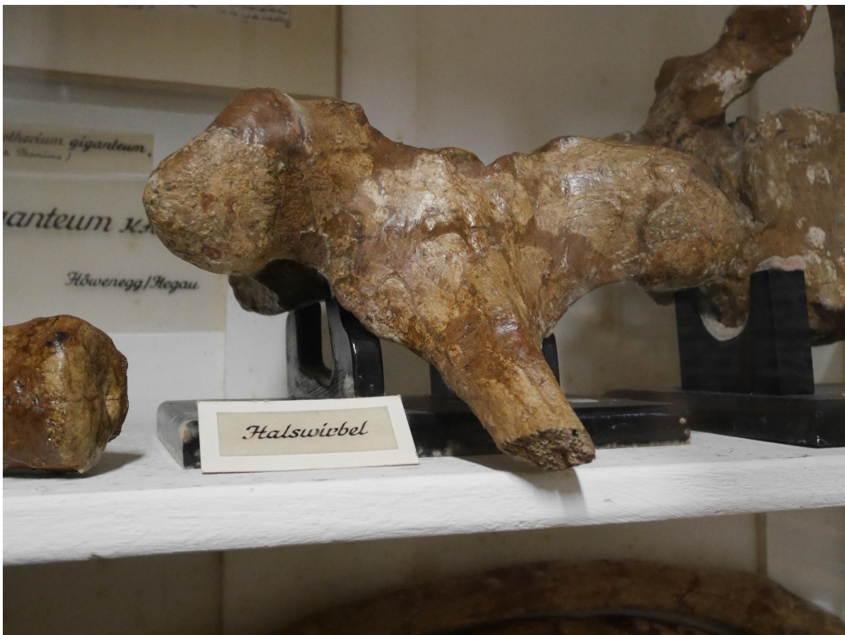
Fürstlich Fürstenbergische Sammlungen Donaueschingen, Hochvitrine 11, Halswirbel des Deinotherium giganteum (Pz 4900).