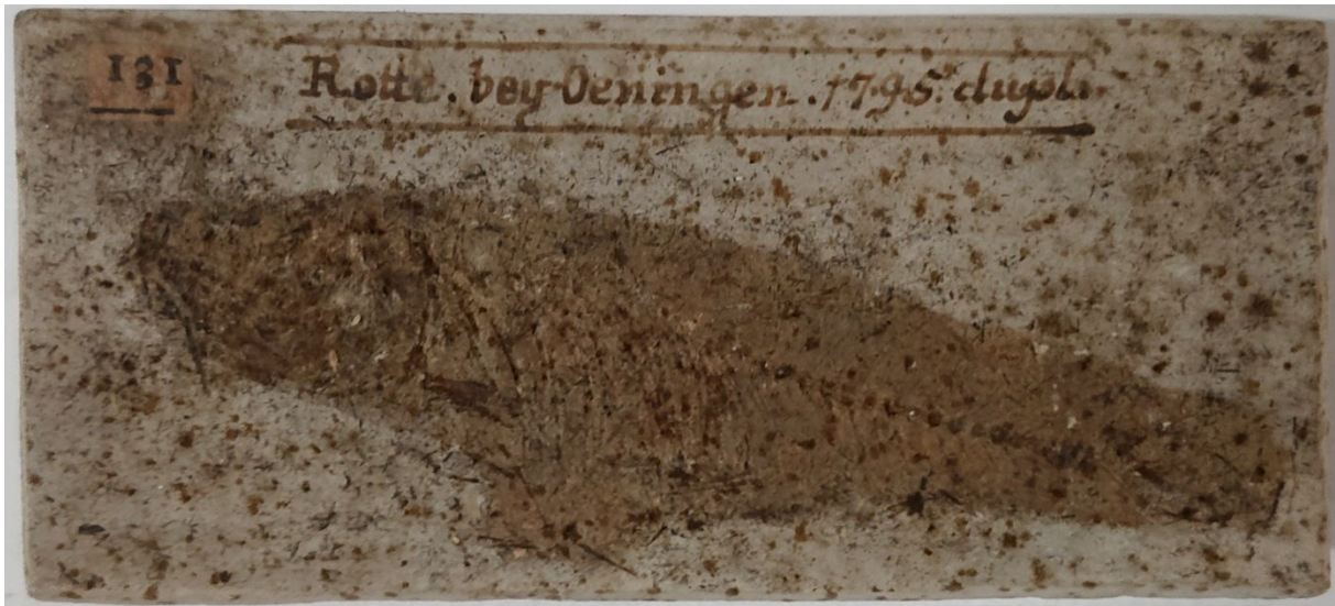
Fürstlich Fürstenbergische Sammlungen Donaueschingen, Vitrine 75, unbestimmte Funde, hier mit Beschriftung von einer Hand des 18. Jahrhunderts als Doublette: „131“ und „Rotte, bey Oeningen. 1795 dupl.“