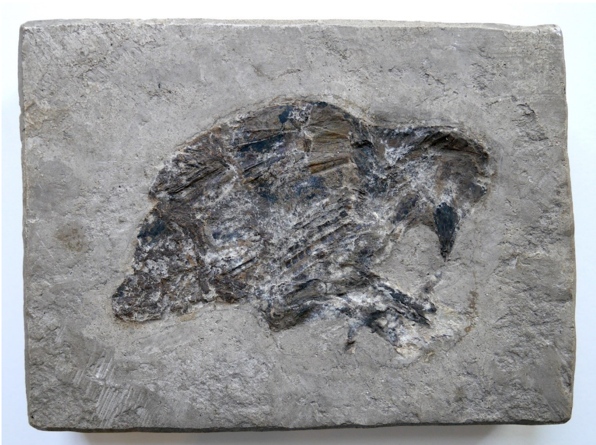
Fürstlich Fürstenbergische Sammlungen Donaueschingen, Vitrine 49, „Wachtelkönig“ (Crex crex), 1836 durch Hermann von Meyer als Fälschung erkannt (Pz 4924).

Jörg Martin, Donaueschinger Museumsnacht 22. Juni 2024