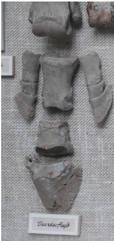
Fürstlich Fürstenbergische Sammlungen Donaueschingen, Tischvitrine links neben Hochvitrine 11, dreizehiger Vorderfuß des Hipparions (Pz 4899).