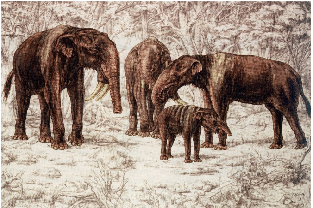
Deinotherium giganteum , Abbildung aus: Göhlich 2010, S. 366 (siehe Literaturverzeichnis).

Der Gegensatz zwischen den Fossilien aus Öhningen und jenen vom Höwenegg, denen in den Donaueschinger Sammlungen ein großer Hochschrank und zwei Tischvitrinen im vorderen Saal gewidmet sind, könnte größer kaum sein: Hier die zarten Pflanzen- und Insektenfossilien aus dem Öhninger Kalk, dort die großen Knochen der am Höwenegg gefundenen Großsäuger. Die rund zwei–drei Millionen Jahre jüngeren Funde vom Höwenegg stammen von Grabungen in den Jahren 1950–1963, die das Haus Fürstenberg, damals noch Eigentümer des Grundstücks, mitfinanzierte.