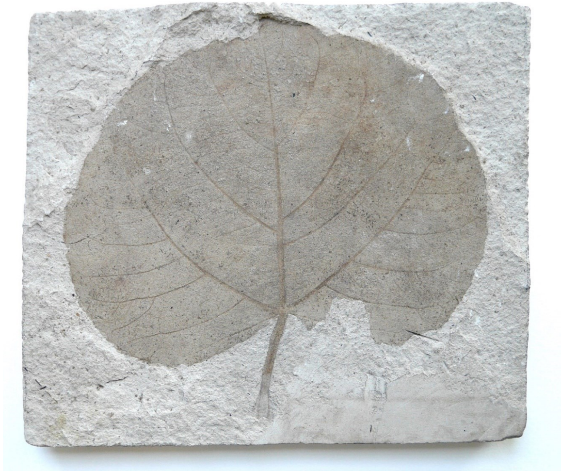
Fürstlich Fürstenbergische Sammlungen Donaueschingen, Vitrine 49, Blatt einer Pappel Populus latior v. cordifolia A.BRAUN (Pb 4680.1).

Die Vitrine mit den Fossilien aus den Steinbrüchen von Öhningen gehört zur Ersteinrichtung des um 1870 eröffneten Gebäudes der fürstlich fürstenbergischen Sammlungen, ist also ihrerseits bereits mehr als 150 Jahre alt. Die ausgestellten Objekte fesseln nicht nur wegen ihres naturwissenschaftlichen Erkenntniswertes, sondern auch wegen ihrer Forschungsgeschichte und nicht zuletzt wegen ihrer herausragenden Ästhetik.