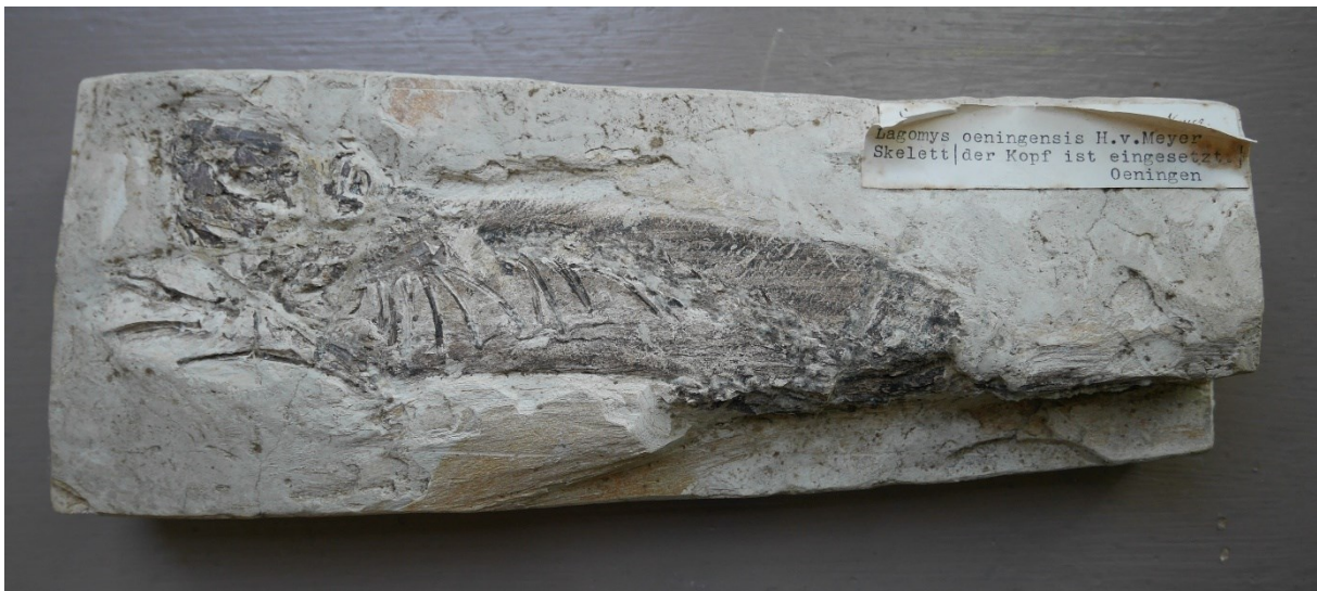
Fürstlich Fürstenbergische Sammlungen Donaueschingen, Vitrine 49, Pfeifhase Lagomys oeningensis mit eingesetztem Kopf, vor der Bestimmung durch Meyer als „Wasserratte“ bezeichnet (Pz 4928.1).